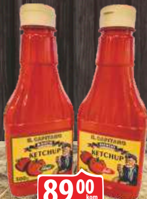
KEČAP IL CAPITANO 500ML BLAGI/LJUTI