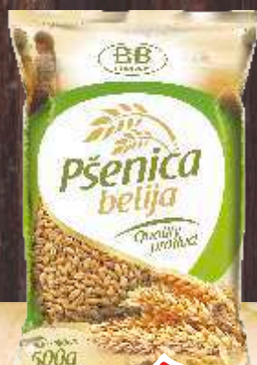
PŠENICA BELIJA 500G UNAC