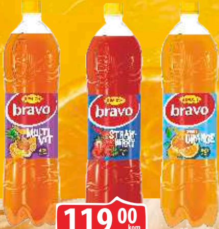
SOK BRAVO 1,5L MULTIVITAMIN/JAGODA/ORANGE