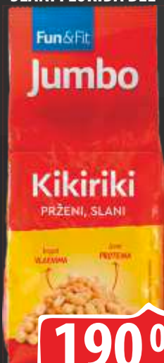
KIKIRIKI JUMBO 250G PRŽENI SLANI FLORIDA BEL