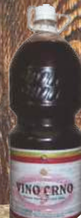
VINO CRNO 2L PET VINARIJA STATUS