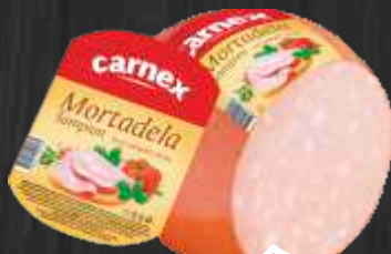
MORTADELA CARNEX ŠAMPION RFS