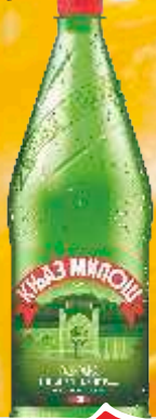
VODA KNJAZ MILOŠ 1,25L GAZIRANA