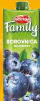
SOK NECTAR FAMILY 1L BOROVNICA