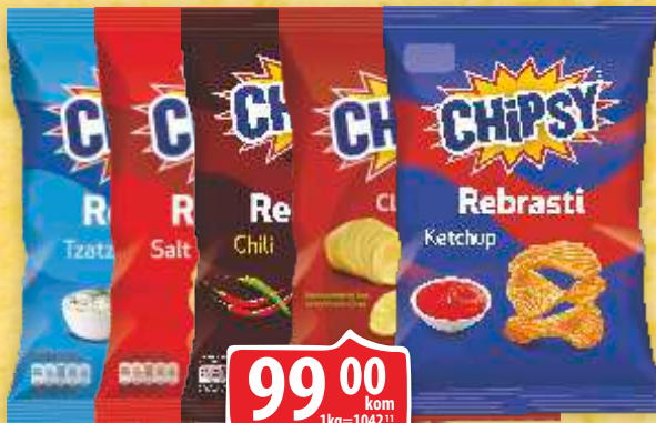
CHIPSY MARBO 95G VIŠE VRSTA