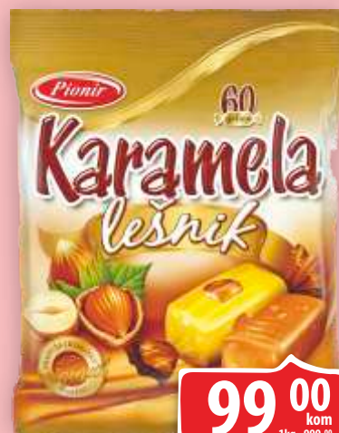
BOMBONE PIONIR 100G LEŠNIK KARAMELA