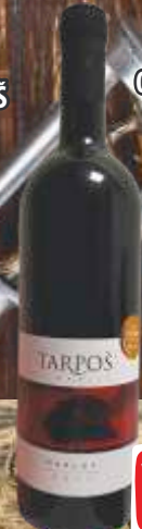
VINO CRVENO MERLOT 0,75L VINARIJA TARPOŠ