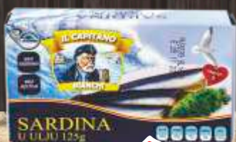
SARDINA U ULJU 125G CAPITANO