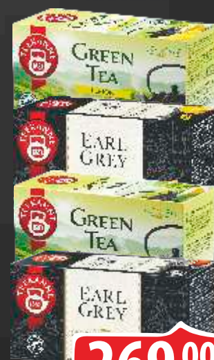
ČAJ TEEKANNE VIŠE VRSTA