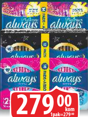
ULOČI ALWAYS ULTRA VIŠE VRSTA