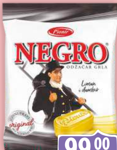
BOMBONE NEGRO 100G LIMUN I ĐUMBIR PIONIR