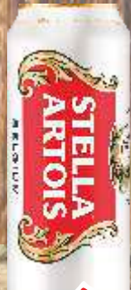
PIVO STELLA ARTOIS SVETLO 500ML LIMENKA