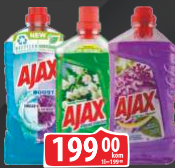
SREDSTVO ZA ČIŠĆENJE AJAX 1L VIŠE VRSTA