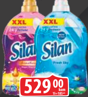
OMEKŠIVAČ SILAN 2850ML FRESH SKY/MAGNOLIA