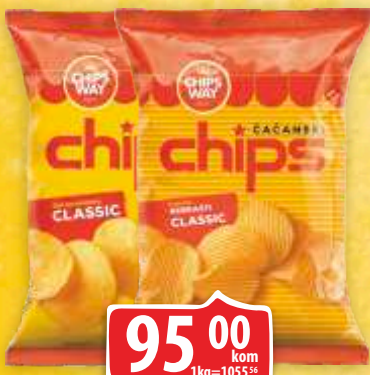
CHIPS WAY 90G CLASSIC/REBRASTI