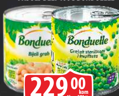
GRAŠAK BONDUELLE 400G PASULJ BELI 400G BONDUELLE