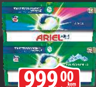
DETERDŽENT ARIEL CAPSULES PODS 29/1 MOUNTAIN SPRING/ COLOR