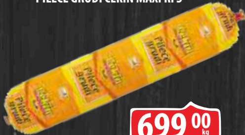
PILEĆE GRUDI CEKIN MAXI RFS