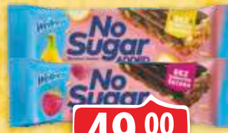
DESERT WELLNESS 23G BANANA&KAKAO MALINA&KAKAO MUSLI