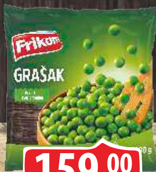
SMRZNUTI GRAŠAK FRIKOM 400G