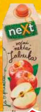
SOK NEXT CLASSIC 1,5L JABUKA