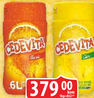
CEDEVITA VIN GRANULE 455G NARANDŽA/LIMUN