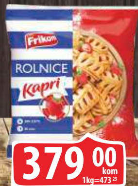
SMRZNUTE ROLNICE FRIKOM 800G KAPRI