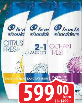
ŠAMPON HEAD&SHOULDERS 400ML CITRUS/CLASSIC CLEAN/OCEAN