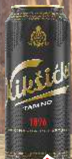
PIVO NIKŠIČKO LIMENKA 0,5L TAMNO

Zabranjena prodaja i sluzenje mladoljetnim osobama. Prekomerno konzumiranje alkoholnih pića dovodi do obiteljnog društvenog rizika.