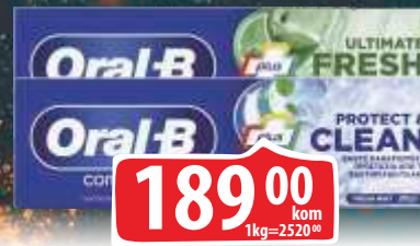
PASTA ZA ZUBE ORAL B 75ML PROTECT&CLEAN/ULTIMATE FRESH