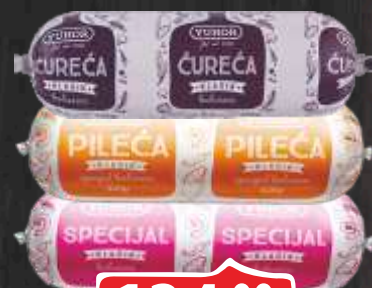
KOBASICA SPECIJAL VIŠE VRSTA 325G UHUOR