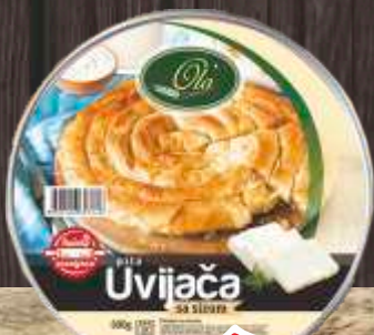
SMRZNUTI BUREK SA SIROM 600G UVIJAČA MOD COMMERCE