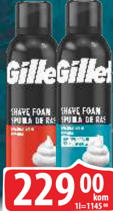
PENA ZA BRIJANJE GILLETTE 200ML ORIGINAL/SENSITIVE