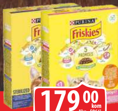
HRANA ZA MAČKE FRISKIES 300G JUNIOR/LOSOS