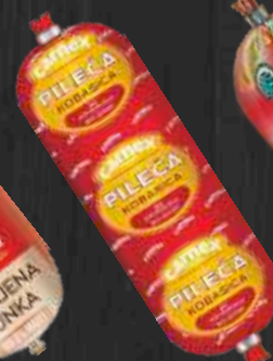
PILEĆA KOBASICA CARNEX RFS