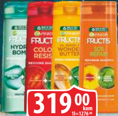
ŠAMPON GARNIER FRUCTIS 250ML VIŠE VRSTA