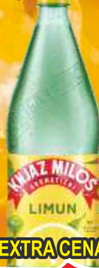
VODA KNJAZ MILOŠ 1,25L LIMUN