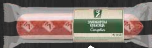
SENDVIČ KOBASICA ZLATIBORAC RFS