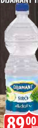
SIRĆE ALKOHOLNO DIJAMANT 1L