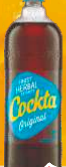
SOK COCKTA 1,5L ORIGINAL FINEST HERBAL