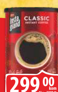
KAFA GRAND INSTANT CLASSIC 100G