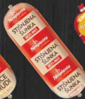
STIŠNJENA ŠUNKA DELIKATES NEOPLANTA RFS