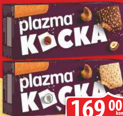
PLAZMA KOČKA PRELIVENA ČOKOLADOM 135G PLAZMA KOČKA PRELIVENA BELOM ČOKOLADOM 130G