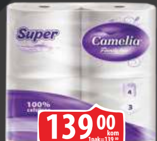
TOALET PAPIR CAMELIA 4/1 SUPER TROSLOJN