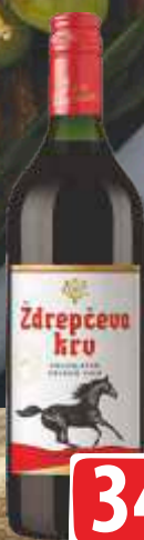
VINO ŽDREPČEVA KRV 1L ČOKA