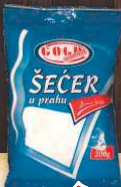
ŠEĆER PRAH GOLD 200G