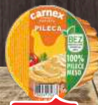
PAŠTETA PILEĆA CARNEX 75G BEZ ADITIVA