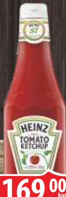
KEČAP HEINZ 450G