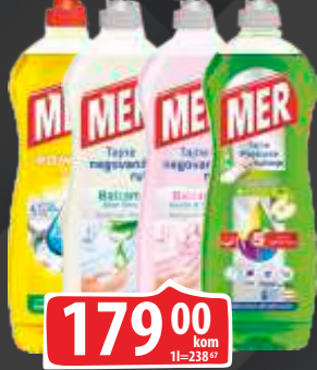
TEČNOST ZA POSUĐE MER BALSAM 750ML VIŠE VRSTA