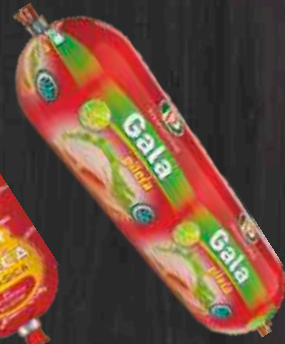
PILEĆA POSEBNA GALA 500G PTUJ