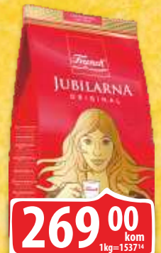
KAFA JUBILARNA FRANCK 175G