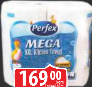
PAPIRNI UBRUSI PERFEX MEGA 2/1 2-SL