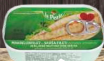
SKUŠA LA PERLA 115G FILETI