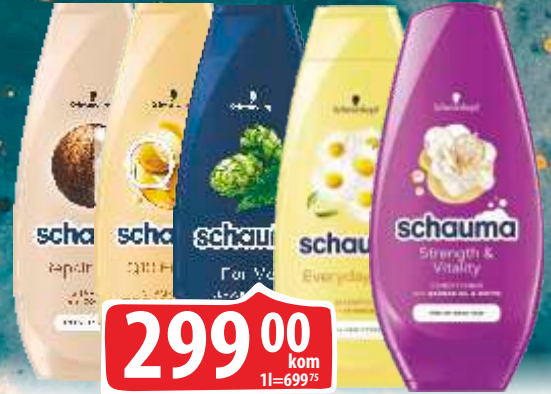
ŠAMPON SCHAUMA 400ML VIŠE VRSTA