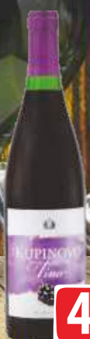
VINO KUPINOVO ČOKA 0,75L