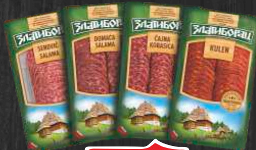
ČAJNA KOBASICA ZLATIBORAC DOMAĆA SALAMA /KULEN/SENDVIČ SALAMA 100G SLAJŠ