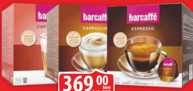
KAPSULE PERFETTO CAFFE LATTE 160G KAPSULE PERFETTO CAPPUCCINO 120G KAPSULE PERFETTO ESPRESSO 70G