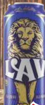
PIVO LAV 0,5L LIMENKA