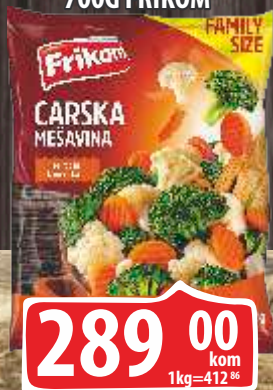
SMRZNUTA CARSKA MEŠAVINA 700G FRIKOM