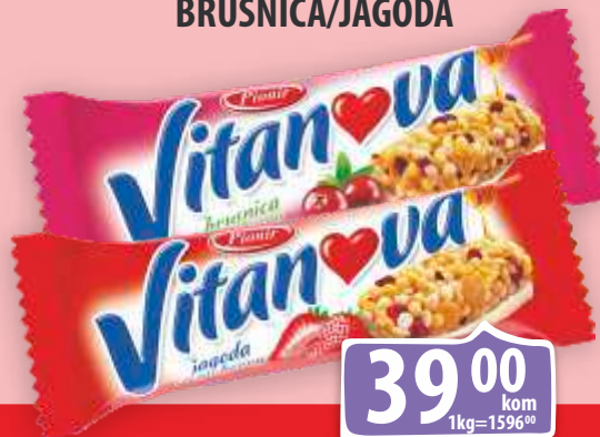
DESERT VITANOVA 25G BRUSNICA/JAGODA