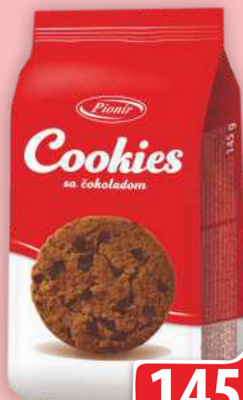
KEKS VITANOVA COOKIES SA ČOKOLADOM 145G PIONIR