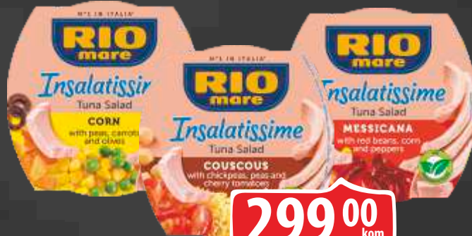
TUNJEVINA RIO MARE 160G VIŠE VRSTA