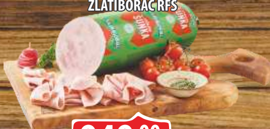
STIŠNJENA ŠUNKA ZLATIBORAC RFS