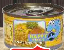
TUNJEVINA HAPPY TUNA 95G KOMADIĆI