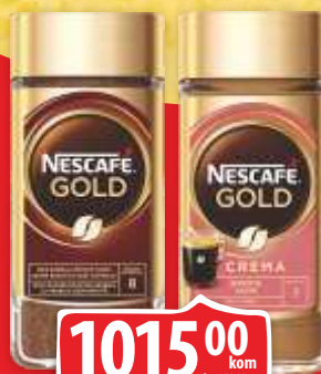
KAFA NESCAFE GOLD CREMA KAFA NESCAFE GOLD 190G