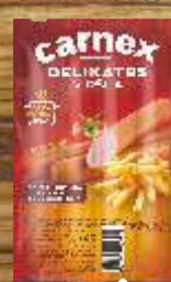
VIRŠLA CARNEX DELIKATES 205G