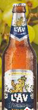
PIVO LAV PREMIUM 0,5L RGB STAKLO