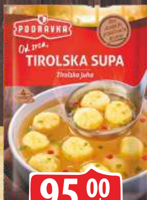
SUPA PODRAVKA 67G TIROLSKA