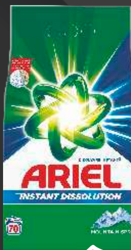
DETERDŽENT ARIEL 5.25KG MOUNTAIN SPRING