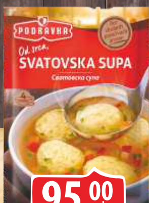
SUPA PODRAVKA 58G SVATOVSKA