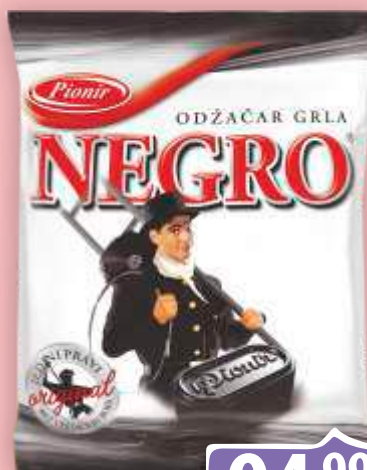
BOMBONE PIONIR 100G NEGRO