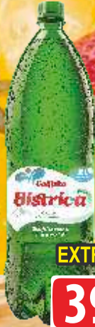
VODA BISTRICA 2L GAZIRANA