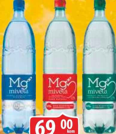
VODA MG MIVELA 1,75L NEGAZIRANA BLAGO GAZIRANA/GAZIRANA