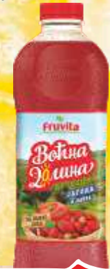
SOK VOĆNA DOLINA 1,5L JAGODA I JABUKA