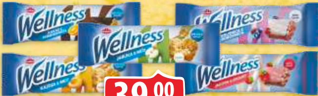
DESERT WELLNESS 23G VIŠE VRSTA