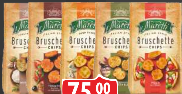
KREKER MARETTI 70G VIŠE VRSTA