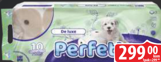
TOALET PAPIR PERFETTO DELUXE 10/1 TROSLOJNI