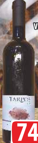
VINO CUVÉE 0,75L CRVENI VINARIJA TARPOŠ