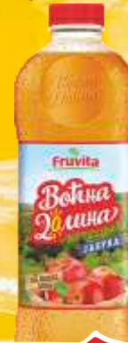
SOK VOĆNA DOLINA 1,5L JABUKA