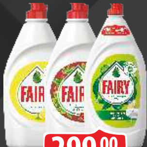
TEČNOST ZA POSUĐE FAIRY 900ML VIŠE VRSTA