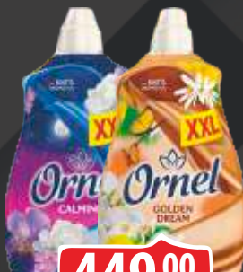
OMEKŠIVAČ ORNEL 2,4L CALMING/GOLDEN DREAM