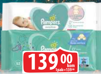
MARAMICE VLAŽNE PAMPERS 52/1 FRESH CLEAN NEW/SENSITIVE NEW