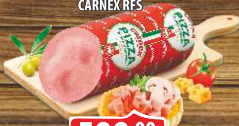
PIZZA ŠUNKA CARNEX RFS