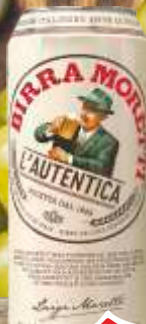
PIVO BIRRA MORETTI 0,5L SVETLO LIMENKA