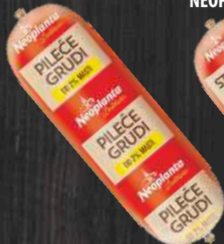
PILEĆE GRUDI DELIKATES NEOPLANTA RFS