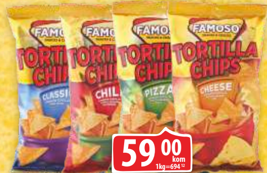
TORTILJA ČIPS FAMOSO 85G VIŠE VRSTA