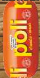
PARIZER POLI MAXI PTUJ RFS