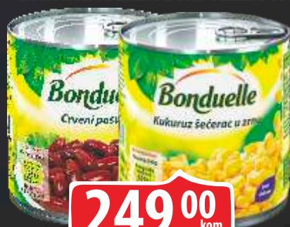
CRVENI PASULJ BONDUELLE 400G KUKURUZ ŠEĆERAC BONDUELLE 340G