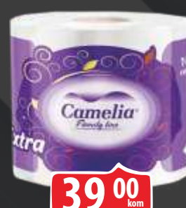
TOALET ROLNA CAMELIA 1/1 EXTRA TROSLOJNA