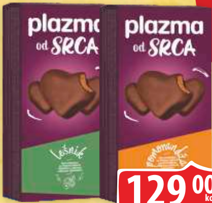
KEKS PLAZMA OD SRCA 100G LEŠNIK/ NARANDŽA