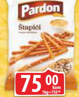
ŠTAPIĆI MARBO 100G PARDON PUNJENI KIKIRIKIJEM