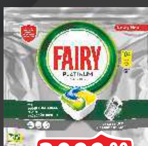
TABLETE FAIRY ZA SUDOVE ALL IN ONE 96/1 PLATINUM