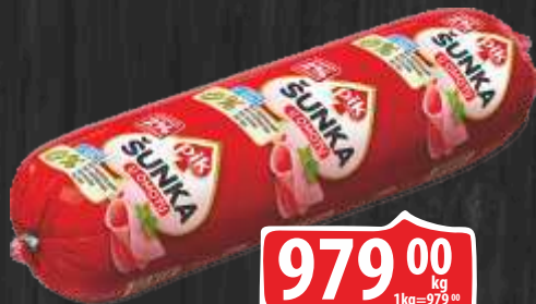
ŠUNKA U OMTU PIK RFS