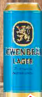
LOWENBRAU 0.5 LIMENKA