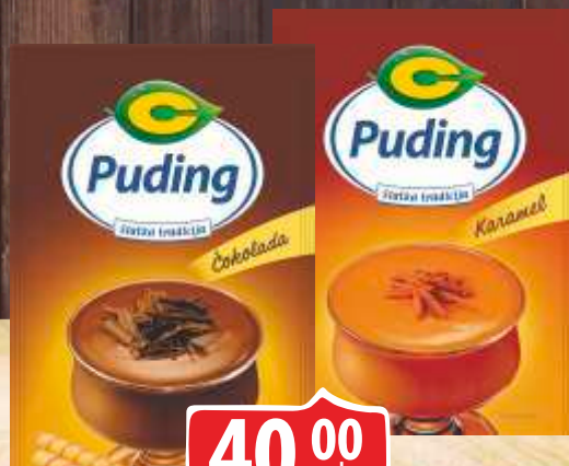
PUDING C 40G ČOKOLADA KARAMELA