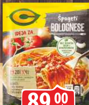
SOS C 50G BOLOGNESE