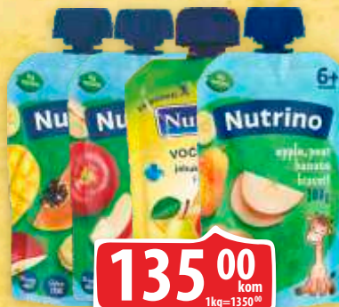
PIRE NUTRINO 100G VIŠE VRSTA