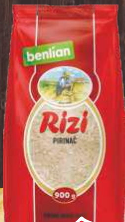
PIRINAČ RIZI 900G K-PLUS