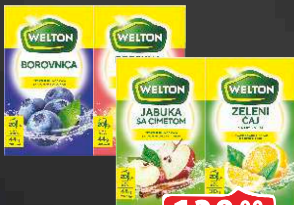
ČAJ WELTON VIŠE VRSTA