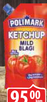
KEČAP POLIMARK 280ML BLAGI DOJPAK