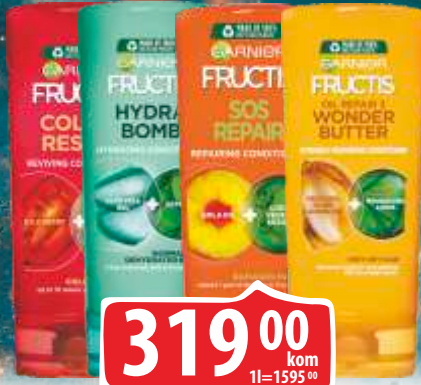
REGENERATOR GARNIER FRUCTIS 200ML VIŠE VRSTA