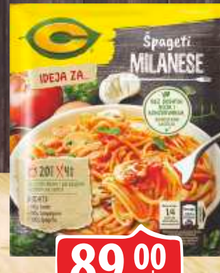
SOS C 45G MILANESE