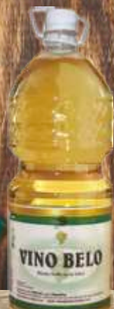
VINO BELO 2L PET VINARIJA STATUS