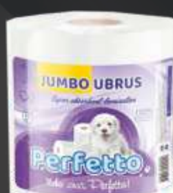
PAPIRNI UBRUS PERFETTO JUMBO U-300 100% CELULOZA