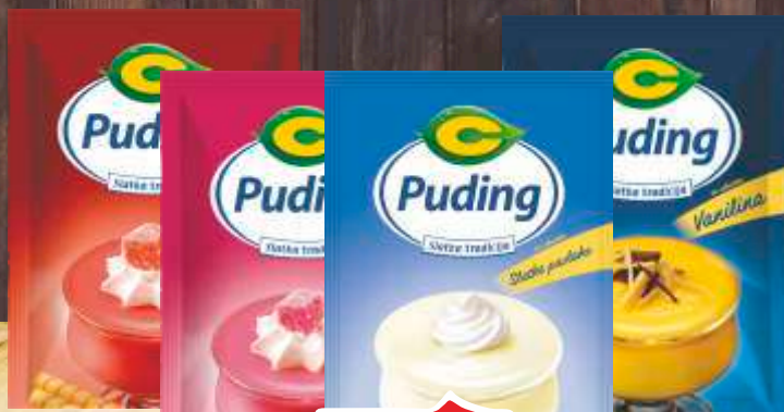
PUDING C 40G VANILA, MALINA, S LATKA PAVLAKA, JAGODA