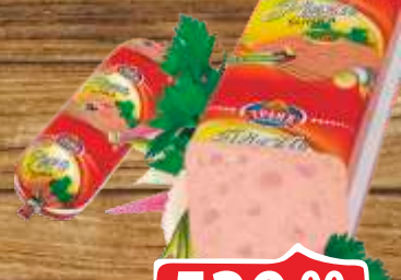
PIZZA ŠUNKA TRLIĆ RFS