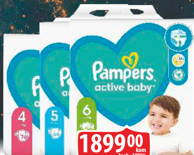
PELENE PAMPERS GPP VIŠE VRSTA