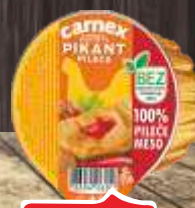
PAŠTETA PILEĆA PIKANT CARNEX 75G BEZ ADITIVA