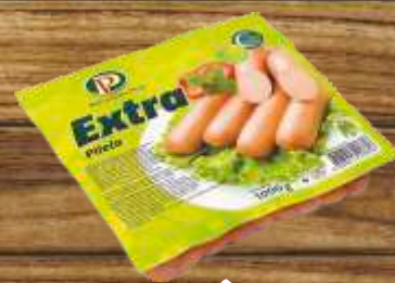
VIRŠLE PILEĆA EXTRA 1000G POLI PTUJ