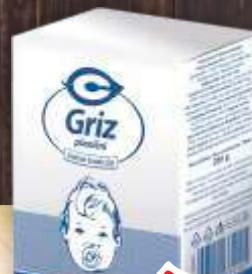
GRIZ C 200G