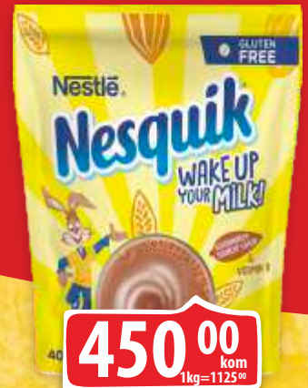
NAPITAK NESQUIK 400G