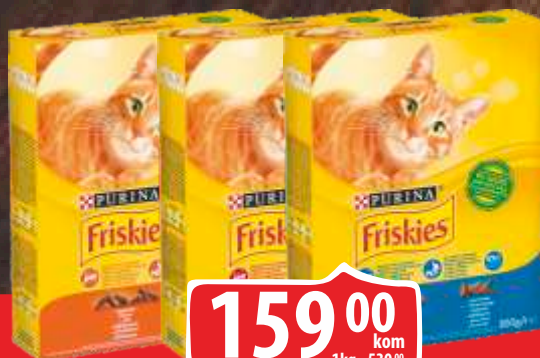
HRANA ZA MAČKE FRISKIES 300G LOSOS BRIKET/PILETINA POVRĆE/MESO