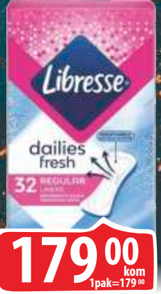
ULOČI DNEVNI LIBRESSE NORMAL MULTI 32/1