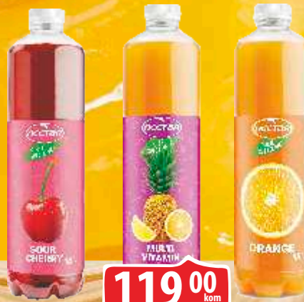
SOK NECTAR NIJE SVEJEDNO 1,5L SOUR CHERRY/MULTIVITAMIN/POMORANDŽA