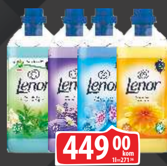
OMEKŠIVAČ LENOR 1.625ML