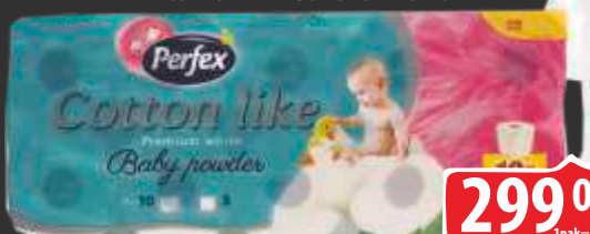
TOALET ROLNA BONI PERFEX 10/1 COTTON LIKE 3SL BEBY POWDER