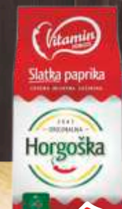
PAPRIKA HORGOSKA 50G SLATKA