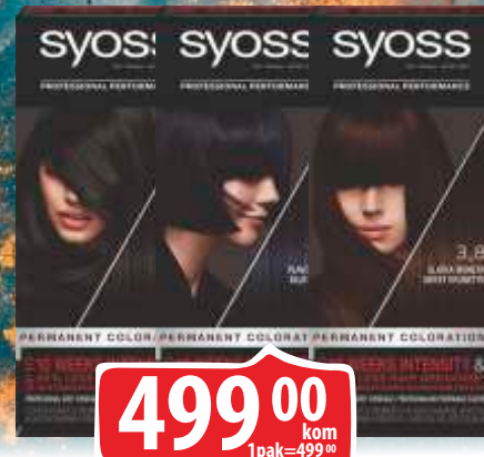
FARBA ZA KOSU SYOSS VIŠE VRSTA