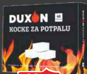
KOCKE ZA POTPALU DUXON 48/1