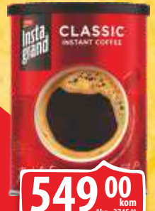
KAFA GRAND INSTANT CLASSIC 200G