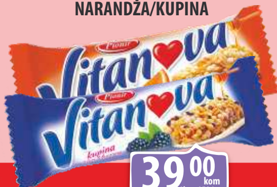
DESERT VITANOVA 25G NARANDŽA/KUPINA