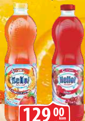
SOK HELLO NARANDŽA NEKTARINA VIŠNJA 1,5L