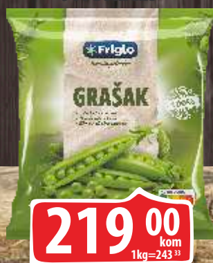
SMRZNUTI GRAŠAK 900G FRIGLO