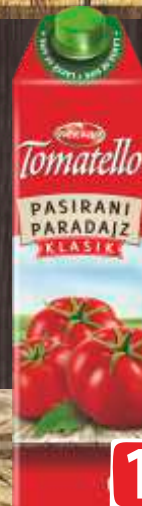
PARADAJZ PASIRANI NECTAR 1L TOMATELLO