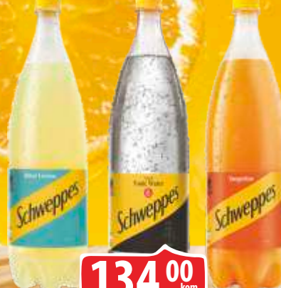
SOK SCHWEPES 1,5L BITTER LEMON/TANGERINE/TONIC WATER