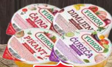
PAŠTETA YUHOR 50G VIŠE VRSTA