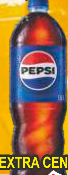
SOK PEPSI COLA 1,5L PVC