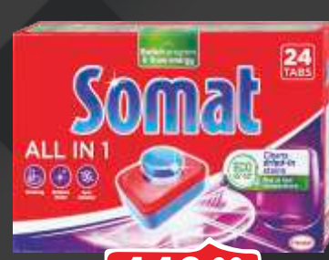
TTABLETE SOMAT ALL IN ONE EXTRA 24/1