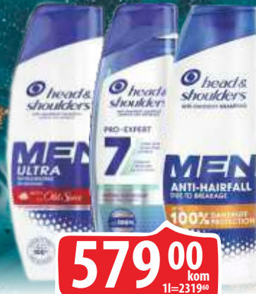
ŠAMPON HEAD&SHOULDERS 330ML MEN ULTRA AHF MEN ULTRA OLD SPICE/PRO-EXPERT 7